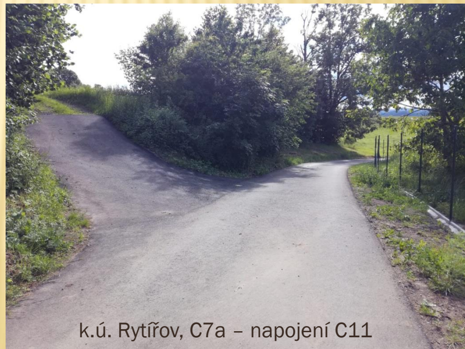
k.ú. Rytířov, C7a – napojení C11