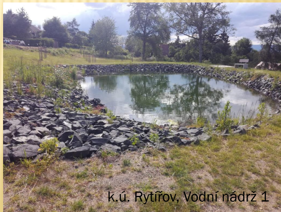
k.ú. Rytířov, Vodní nádrž 1